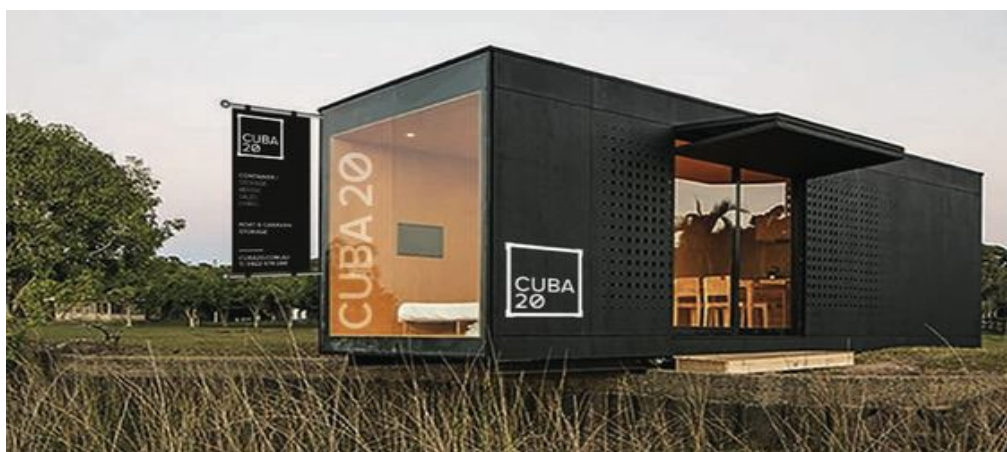
Fot. Mobilne obiekty użytkowe - przykłady podobnych realizacji