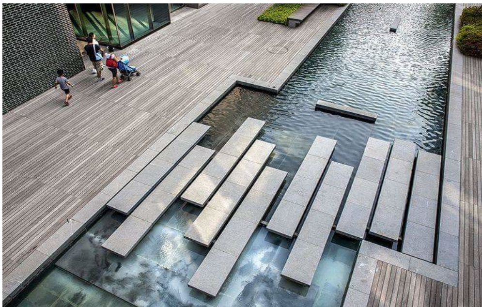
Wodny zbiornik parkowy - przykłady podobnych realizacji.

Realizacja koncepcji podstawowej zaprezentowanej w dokumentacji, nie wyklucza na dalszym etapie realizacji koncepcji alternatywnej z odtworzeniem historycznej fosy. Inną możliwością oznaczenia fosy, jest np. wykonanie parkowych powierzchni z wodą filtrowaną w formie szczelnych zbiorników.