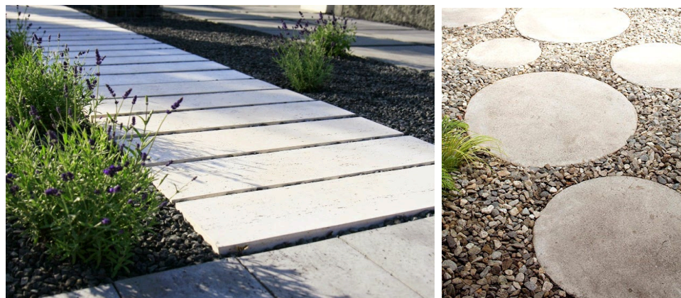
Fot. Posadzki parkowe - przykłady podobnych realizacji.