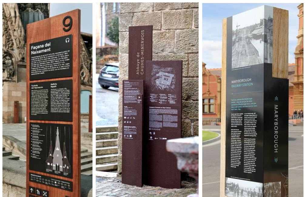
Fot. Tablice informacyjne - przykłady podobnych realizacji

Przedstawiona historia zamku dotyczyła by okresu XVII – XIX. W tej strefie znalazły by się też tablice ogólne (nr 1.) z podstawowymi informacjami o zamku i okresie funkcjonowania strefy zamkowej po wyburzeniu zamku oraz procesu powstawania aktualnej ekspozycji itp.