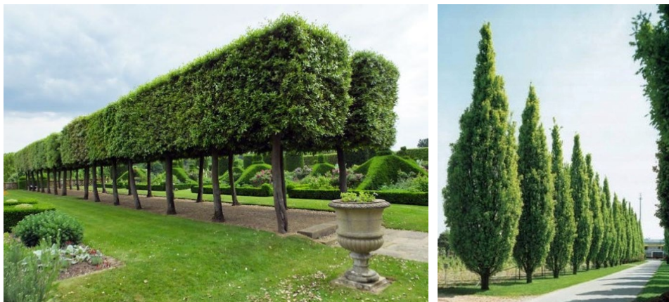
Fot. Drzewa parkowe - przykłady podobnych realizacji.

Główna idea zagospodarowania terenu opiera się na uczytelnieniu historycznego układu urbanistycznego, a w szczególności – budynku zamkowego w wszystkich jego fazach rozwoju, nasypu przedzamkowego wraz z murem obwodowym, bastionów przyzamkowych, fosy i innych obiektów fortyfikacji zewnętrznych. Uczytelnienie można zrealizować za pomocą ekspozycji ruin, oświetlenia terenu oraz oznaczenia linii historycznych poprzez odpowiednie umiejscowienie ciągów komunikacyjnych, zieleni, formowania terenu w przypadku np. fosy zamkowej. Przykład takiego działania widoczny jest na rys. R.0.5