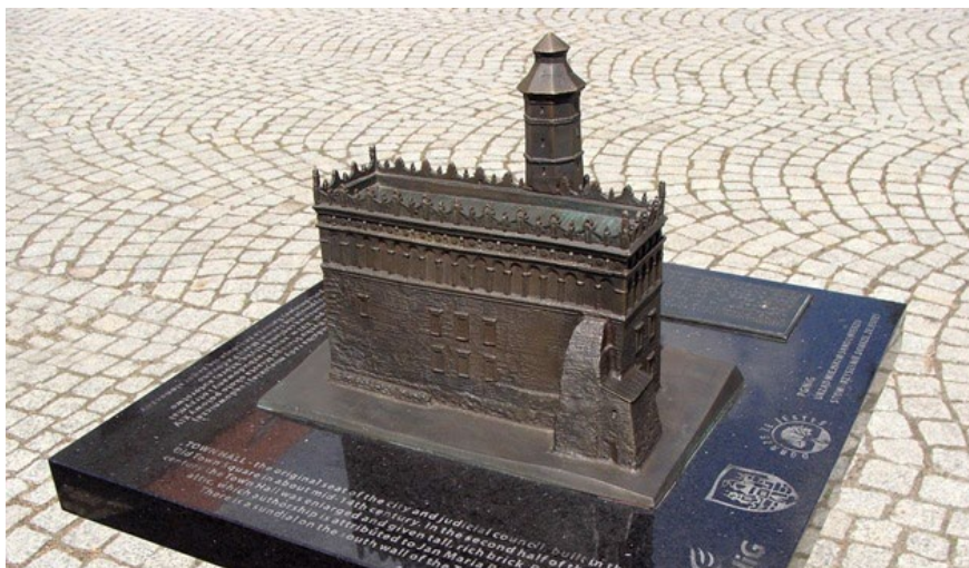
Fot. Makieta - przykład podobnych realizacji

Trasa była dostępna w sezonie letnim, jako część biletowana i dotyczyłaby opowieści o historii zamku średniowiecznego w jego początkowym okresie rozwoju czyli XIV-XVI w. W tej strefie znalazłyby się też makiety pokazujące różne fazy przebudowy i rozbudowy obiektu.